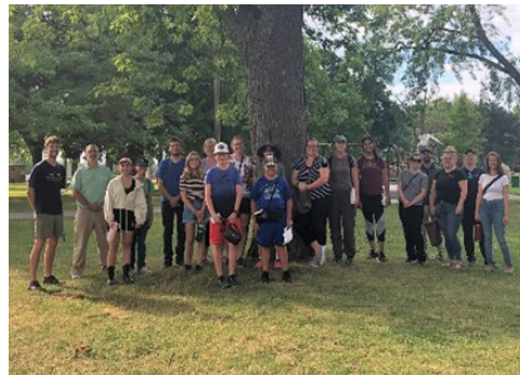
Los miembros de la comunidad asistieron a la caminata de identificación de árboles de ERCA en agosto de 2022 en Mic Mac Park, en Sandwich.