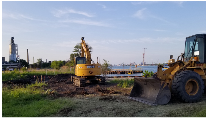
La nivelación del sitio se llevó a cabo en el verano para preparar la construcción del área de observación en River Rouge.

Continúa la construcción del proyecto Bridgeview Point para crear un área de observación en River Rouge.