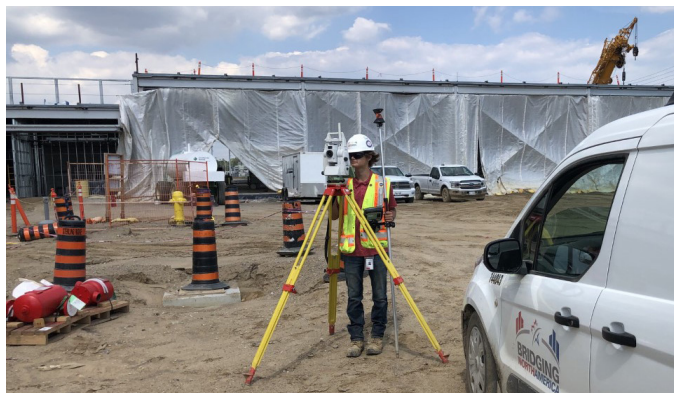
Un estudiante local aprende sobre topografía en el Punto de entrada canadiense.

El equipo del proyecto apoya los programas de capacitación para el desarrollo de la fuerza laboral a través de colaboradores para la realización, identificados en Windsor y Detroit. Como resultado de estos programas, los trabajadores locales tienen la oportunidad de desarrollar las habilidades necesarias para carreras en la industria de la construcción. Un graduado de Access For All Apprenticeship Readiness Cohort 18 fue patrocinado por BNA como aprendiz de carpintero y actualmente está trabajando en el Intersección en Michigan. Visite el sitio web del proyecto para obtener más información sobre cómo trabajar en el proyecto y con los sindicatos participantes.