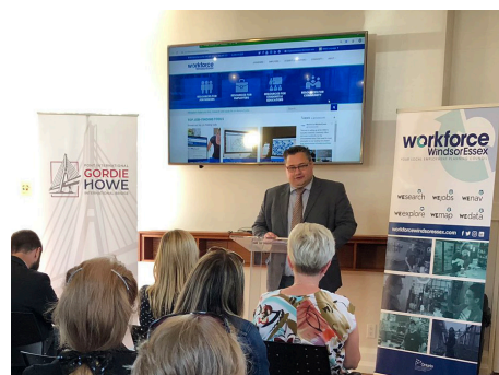
Lanzamiento de la herramienta Bridge Jobs Tool

En agosto de 2019, Workforce WindsorEssex lanzó la herramienta 'Bridge Jobs Tool'. Esta herramienta fácil de usar rastrea y comparte públicamente las ofertas de trabajo canadienses y los hitos del proyecto relacionados con el proyecto del Puente Internacional Gordie Howe. Para obtener más información, visite: workforcewindsor.essex.com/bridge-jobs-tool .