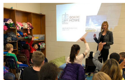
St. James WE-STEAM 2019

Para solicitar una presentación escolar sobre el Puente Internacional Gordie Howe, llene un formulario de participación en la pestaña 'Contact Us' (Contáctenos) del sitio web.