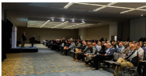
Cumbre de proveedores 2019

En noviembre de 2019 el equipo del proyecto organizó las Cumbres de proveedores en Windsor y Detroit para informar a las empresas locales sobre los plazos del proyecto, las próximas oportunidades de contratación y el proceso de solicitud. Los eventos atrajeron a más de 800 participantes en conjunto, e incluyeron una presentación de BNA seguida de sesiones para establecer contactos.