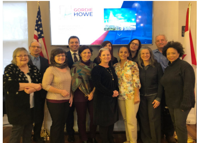
Representantes del Grupo de la comunidad local