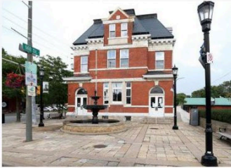
Bureau communautaire de Sandwich 3201, rue Sandwich Windsor