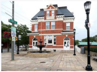
Bureau communautaire de Sandwich 3201, rue Sandwich Windsor

Les heures de rendez-vous disponibles sont les suivantes : Mardi 13 h à 16 h 30 Jeudi 8 h à 12 h