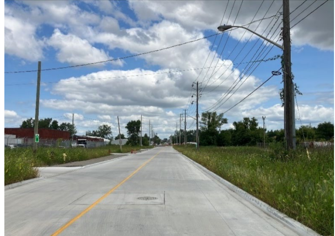
La rue Sandwich entre la promenade Ojibway et le chemin McKee.

Les travaux progressent sans cesse sur le dernier tronçon de la rue Sandwich, de la rue Chippawa au rond-point de l'avenue Rosedale, qui comprend la zone d'amélioration commerciale (ZAC) de Sandwich Towne. La reconstruction comprend la réfection complète de la chaussée et des trottoirs, l'installation de pistes cyclables, d'aménagements paysagers et d'autres améliorations.