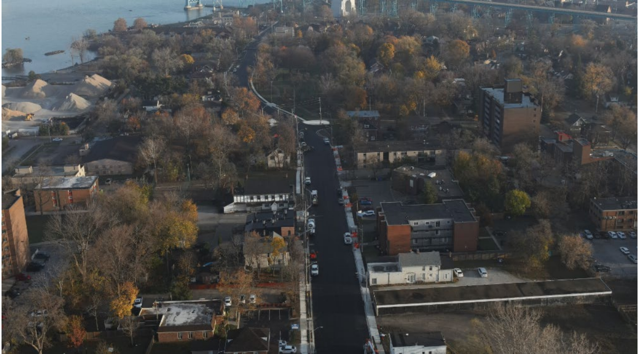
Progrès de la reconstruction de la rue Sandwich, vue de l'est depuis la rue Mill.

Financés par le projet du Pont international Gordie Howe, trois kilomètres de la rue Sandwich sont en cours de reconstruction depuis le point d'entrée canadien de l'avenue McKee jusqu'au rond-point de l'avenue Rosedale.