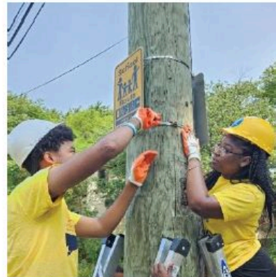
Des étudiants du programme de sécurité urbaine AmeriCorps installent un panneau Safe Route to School dans le sud-ouest de Détroit.

Un programme continu d'intervention en matière de sécurité, plusieurs panneaux d'affichage sur les propriétés et un événement communautaire ont également eu lieu au cours de l'été.