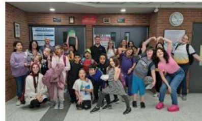
Les élèves et le personnel de l'Ignore Academy pendant le programme parascolaire.

Le personnel de l'Ignore Academy a continué à fournir un soutien global et un programme parascolaire pour 30 jeunes et leurs familles à l'école publique General Brock de Sandwich. En plus du programme, l'équipe a fourni plus de 500 références communautaires et des services d'interprétation linguistique pour répondre à des besoins uniques et améliorer la communication pour les élèves et leurs familles.