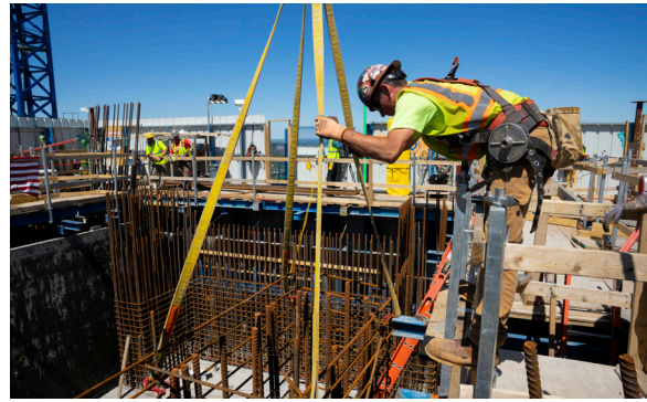
Los herreros construyen la torre del puente en los EE. UU.

empresas locales* participaron en el proyecto