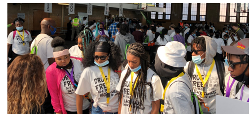
Representantes del proyecto se reúnen con estudiantes de secundaria en la Exposición de Ciencias de la Construcción de Michigan.

Este evento en mayo, en Durfee Innovation Society, brindó una oportunidad para que los estudiantes de secundaria y preparatoria interesados en carreras de ingeniería y construcción se relacionaran con oficios calificados y expertos de la industria del diseño de la construcción.