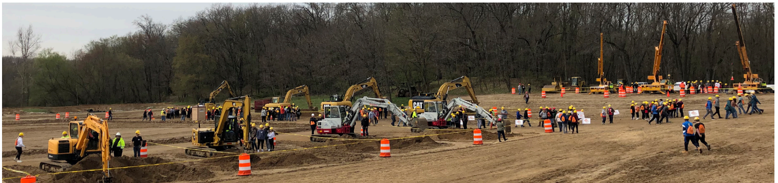
Estudiantes que operan equipos de construcción en Michigan Construction Career Days en mayo de 2022.

La Estrategia de participación y desarrollo de la fuerza laboral apoya la capacitación y las oportunidades para aprendices o pre-aprendices jóvenes locales, lo que incluye promover los oficios calificados e informar a los estudiantes sobre los caminos hacia las carreras en construcción. Para apoyar este objetivo, el equipo del proyecto ha participado en múltiples presentaciones y eventos en los últimos meses.