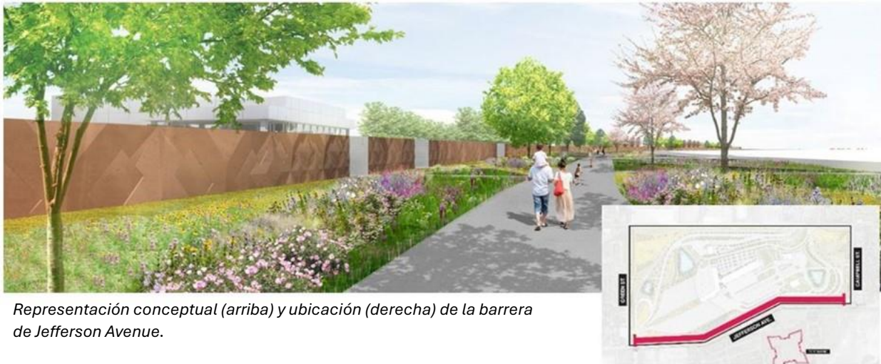
Representación conceptual (arriba) y ubicación (derecha) de la barrera de Jefferson Avenue.

Cada una de las tres barreras acústicas se encuentra en diversas etapas de construcción.