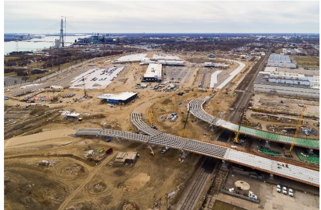
Punto de entrada canadiense (izquierda) y Punto de entrada estadounidense (derecha)