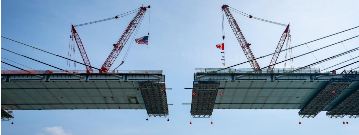
Las plataformas del puente en EE. UU. (izquierda) y Canadá (derecha) están a punto de conectarse.